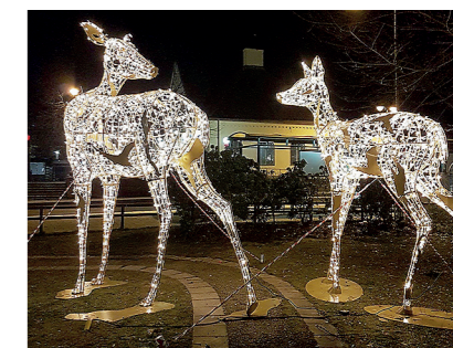
Lysande förslag kan leda till en trisslott.

dess idéer genomförs kommer självklart också dessa förslagsgivare belönas med en trisslott.