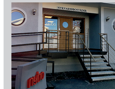
Ingången till nya lokalerna.

Sedan den 1 oktober i år gäller skärpta regler för den som hyr ut sin lägenhet i andra hand. Den som hyr ut utan tillstånd från hyresvärden riskerar att bli av med sitt kontrakt. Men även om man skaffat tillstånd gäller det att se upp, det är nämligen nu straffbart att ta ut högre hyra i andra hand än det som gäller för hyresgästen som har förstahandskontraktet.