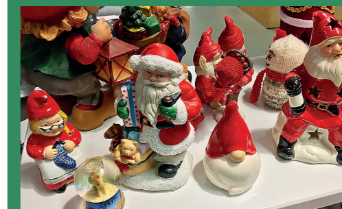
På loftet? Nej, i tidningen – hur många hittar du?