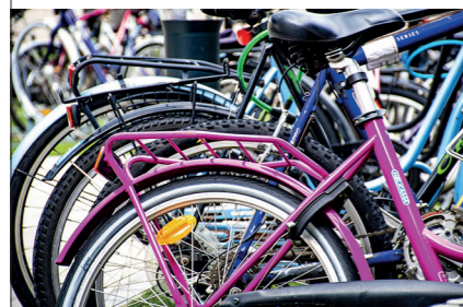
Cyklar har en given plats i planeringen.

Ett tredje bostadsprojekt i kommunen är Älgbostad vid Hökmossbadet. Projektet har varit ute på visning två gånger tidigare men har därefter omarbetats, och detaljplanearbetet pågår.