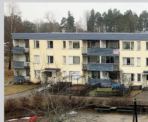
Upprustning på gång.

Upprustningen innebär bland annat byte av stammar och avlopp, nya badrum, nya radiatorer samt byte av fönster.