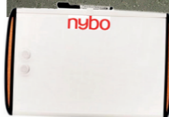
Whiteboard-tavlor ska sättas upp i alla verksamhetslokaler.

nya informationstavlorna att vara på plats inom kort,