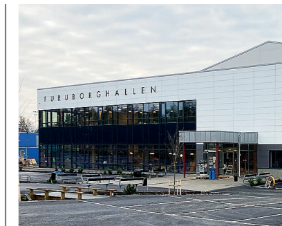
Nykvarns nya idrottshall.