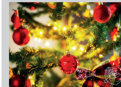
Fin att ha inomhus, mindre fin om den barrande slängs utomhus.

Arbetet gör dock uppehåll under inspelningen av ”Hela Sverige bakar”.