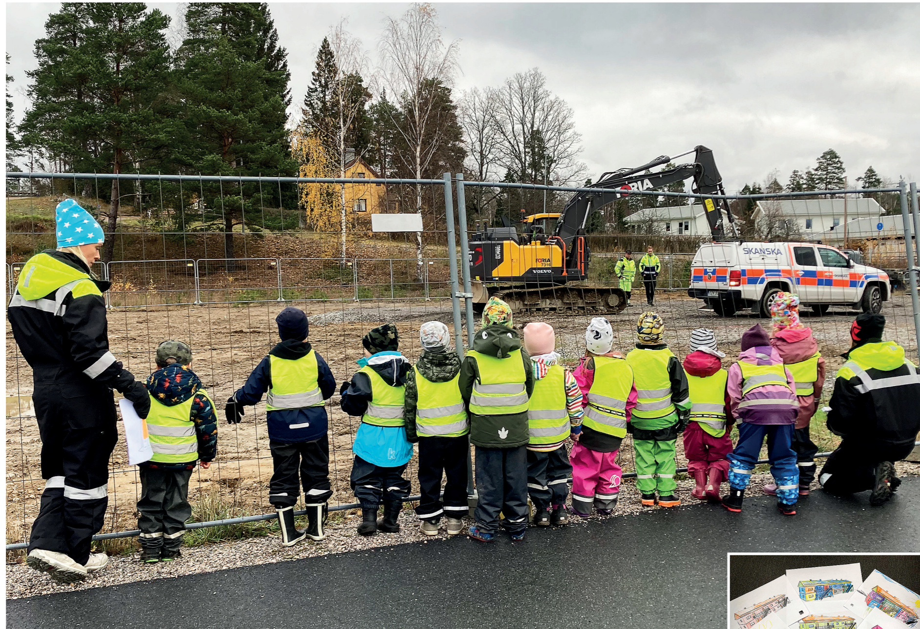
Nyfikna förskolebarn får sig en lektion i hur hus blir till. Till höger syns några av barnens färglagda

till rörligheten på bostadsmarknaden i kommunen. Många äldre sitter i villor som kräver både underhåll och mycket trädgårdsarbete.