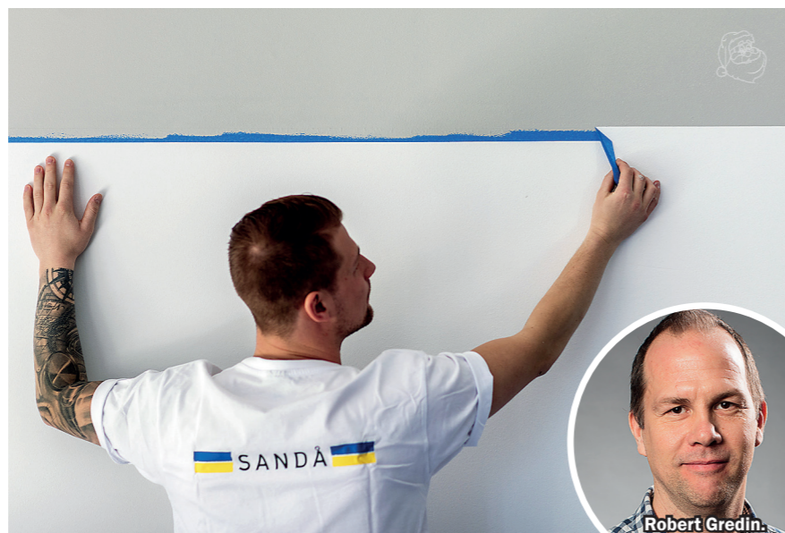
Sandå är tillbaka och tar hand om måleriarbeten för Nybos räkning.

När Sandå nu kommer tillbaka till Nykvarn får han dock lov att lämna över penslar och färg till en kollega. Själv får