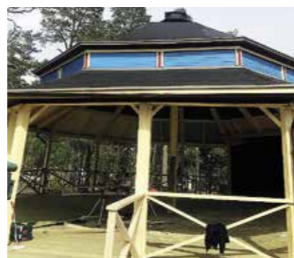
Rotundan i Folkets park har fått nytt golv.

– Stora delar av barngruppen har tempoärt flyttat under byggtiden till förskolepa-