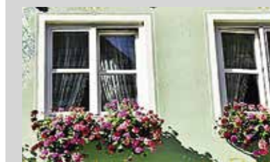
Nej, inte så, även om det är vackert.

Är du intresserad att betala på detta sätt anmäler du det till din bank som i sin tur meddelar Nybo. Därefter lägger de in det i systemet och du får sedan en e-faktura till din internetbank. Du kan även välja att betala din hyra via autogiro.