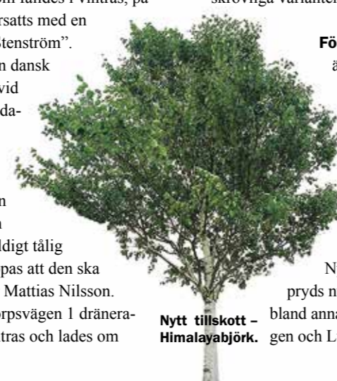
Nytt tillskott – Himalayabjörk.

Förutom träd och buskar är nu alla sommarblommor på plats sedan slutet av maj. Bland annat i centrum vid busshållplatserna, nere vid Järnavägs-dammen och vid rondellen på Maskin-förärvägen. Även Nybos bostadsområden pryds nu av sommarblommor, bland annat på Norra Stationsvägen och Lundavägen 20, liksom