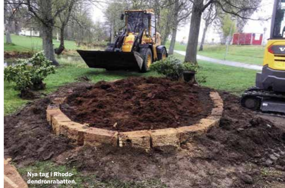
Nya tag i Rhododendronrabatten.