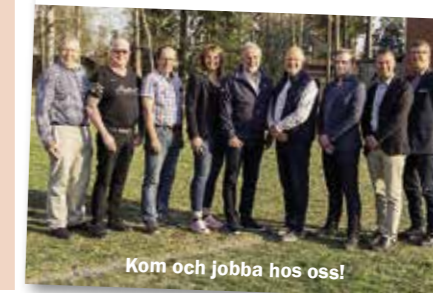
Kom och jobba hos oss!

Mer information om tjänsten, och eventuellt andra lediga arbeten, hittar du under fliken "Lediga Jobb" på Nybos hemsida, www.nybo.se .