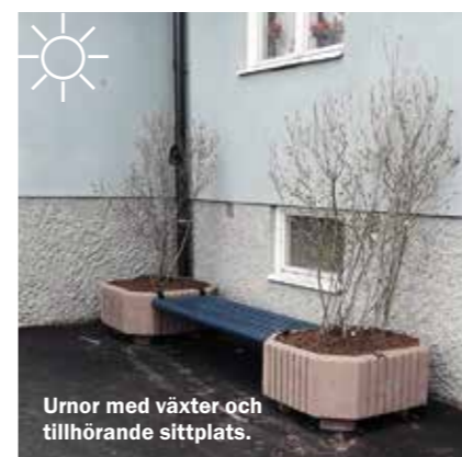
Urnor med växter och tillhörande sittplats.