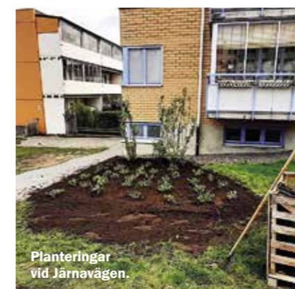
Planteringar vid Järnavägen.

på Skogsvägen, Järnavägen och Dahlbergsvägen.