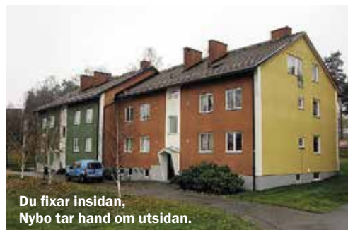
Du fixar insidan, Nybo tar hand om utsidan.

Svar: Du är skyldig att vårda och sköta om din bostad på bästa sätt, inklusive det som hör till lägenheten. Om det inträffar en skada måste du meddela det till Nybos personal så snart som möjligt, allt för att skadan inte ska förvärras. Om du inte meddelar en uppkommen skada kan du bli skadeståndsskyldig.