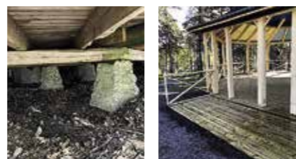
Golvet var ruttet men nu håller det för dans.