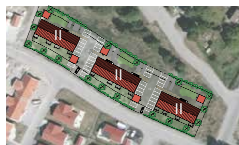
Ett möjligt alternativ till bebyggelse i Brokvarn.

Andra projekt på gång är Tekannan och Tillbringaren på Gammel-torpsvägen där det planeras för två nya hus.