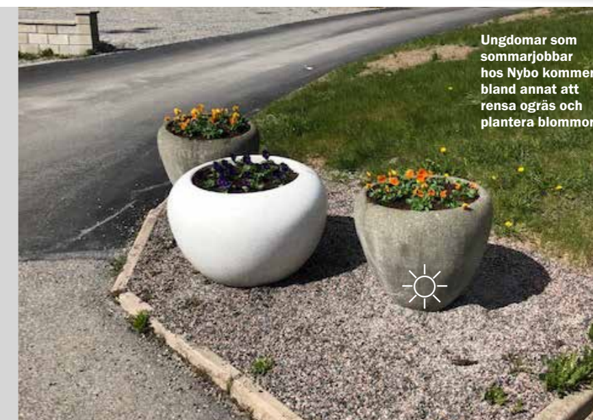
Ungdomar som sommarjobbar hos Nybo kommer bland annat att rensa ogräs och plantera blommor.

Även i år får Nybo hjälp av ungdomar från kommunen som sommarjobbar. Totalt är det 24 ungdomar, uppdelade i mindre grupper, som arbetar i olika omgångar under veckorna 25–33. Nytt upplägg för i år är att ordinarie personal på Nybo är handledare. Sommarjobbarna kommer bland annat att ägna sig åt att rensa ogräs i rabatterna, olja in bord och bänkar, sköta lekplatser och skyffla grusgångar.