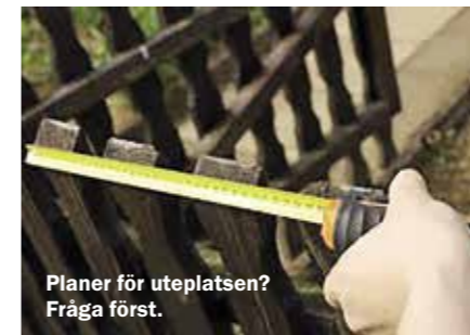
Planer för uteplatsen? Fråga först.

Du vet väl att du som är hyresgäst måste följa Nybos regler även när det gäller utemiljön? Det är alltså inte fritt fram att bygga egen altan, sätta upp grindar och staket eller skaffa stora planteringar utan att be om lov.