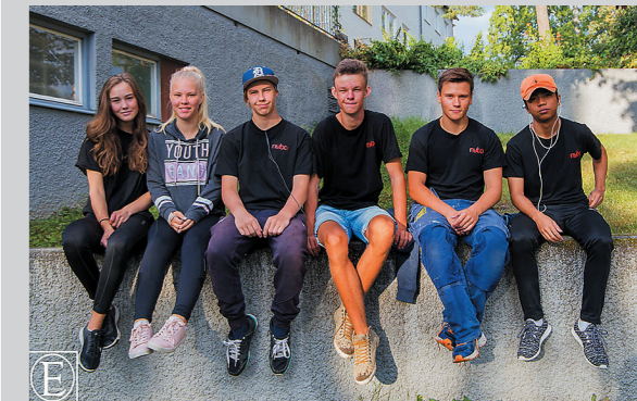
Tredje gänget av sommarjobbade ungdomar.

I samma veva som nya buskar ska planteras kommer även entréerna att snyggas till med ny färg.