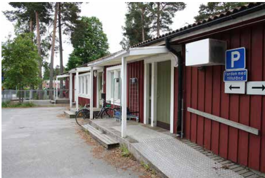
Arbetsmiljön ska bli betydligt bättre på Wincklerska förskolan och Gammeltorps förskola, när de gamla uttjänta ventilationsaggregaten byts ut.