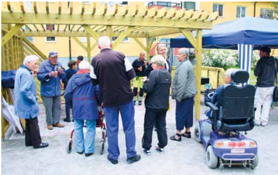
Invigningen av uteplatsen bakom Gammeltorpsvägen 1 lockade snabbt till sig många glada hyresgäster.