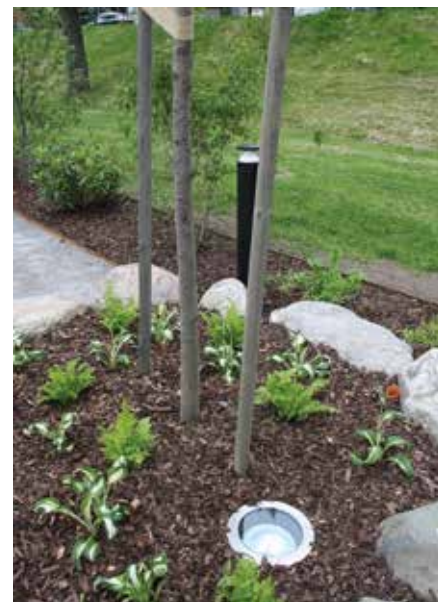
En plantering med växter, ett träd och underbelysning pryder också parke

Lilla Parken är ett bra exempel på Nybos satsning på utemiljön – en satsning som bara fortsätter.