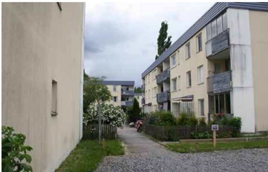
Nu ska fasader, balkonger och fönster på Skogsvägen 3-27 ses över och reoveras under nästa år, om planerna går i lås.

- Det är lättare för oss inom Nybo att kunna ge besked om var all vår personal befinner sig och när de går att nå, säger Leila.