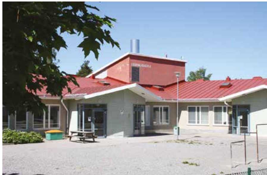
Lillhagaskolan var sist ut av grundskolorna att få det nya automatlåssystemet installerat. Nu är alla skolorna färdiga och projektet övergår till att stärka skalskyddet även på förskolorna.