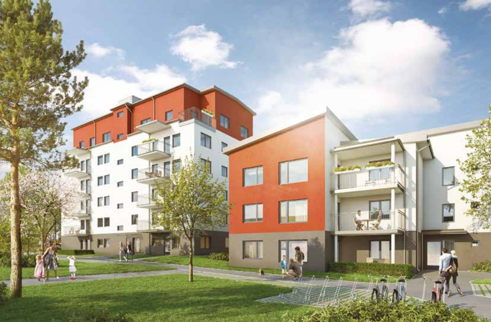
Konstnärens bild av Karaffen i färdigt skick. Illustration: Kalle Eliasson, E3D