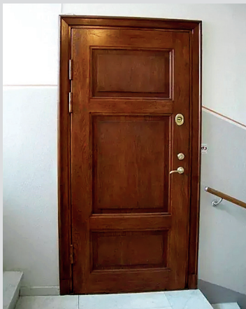
Både tyst och säkert bakom ny dörr.

Du vet väl att Nybo erbjuder hyresgäster möjligheten att byta till säkerhetsdörr? En säkerhetsdörr ökar inte bara säkerheten utan ökar dessutom isoleringen av ljud från trapphuset. Bytet kostar 145 kronor per månad och läggs på hyran. Kontakta Nybo vid intresse av ett dörrbyte.