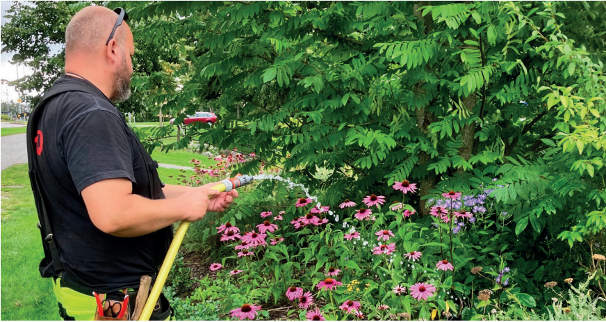
Nybos parkavdelning ser till att det är grönt och fint i hela kommunen.