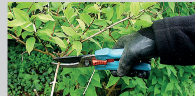
Löv och kvistar är välkomna.

Nybo har ändrade besöks- och telefontider. Receptionen har öppettid för spontana besök på vardagar klockan 07–12. Det går även bra att boka en tid, mellan 07 och 15. Du når oss även via telefon varje helgfri vardag mellan klockan 07 och 16, förutom fredag då tiderna som gäller är 07–15.