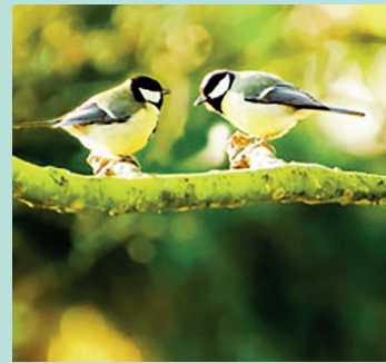
Söta – men mat får de leta själva.